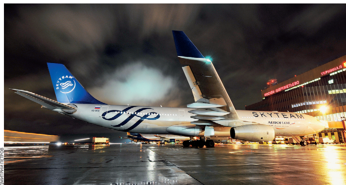
Аэропорт Шереметьево превратился в полнофункциональный хаб для второго по величине в мире авиационного альянса SkyTeam

Какие изменения в области качества обслуживания пассажиров произошли за последний год?