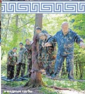
и медные трубы

А знаете ли вы, кто царствует на вершине Кулинарного Олимпа? Конечно, кулинарное производство «Азбуки Вкуса»! Но не сразу обрело оно власть и признание.