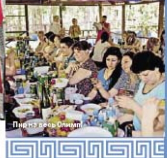
Пир на весь Олимп