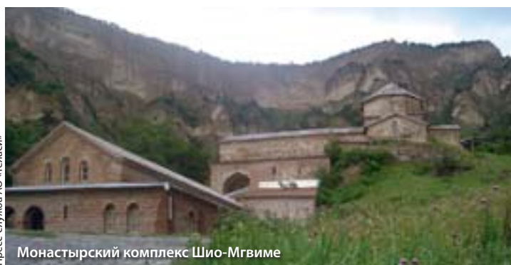
Монастырский комплекс Шио-Мгвиме