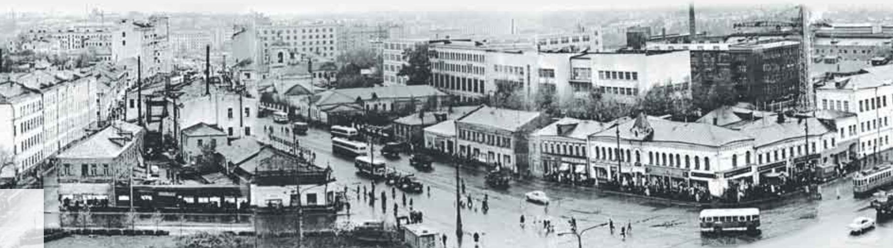
Вид на завод № 37 им. Серго Орджоникидзе со стороны Преображенской площади

XX век начинался для России с тяжелейших потрясений. Поражение в Русско-японской войне. Революция 1905 года. Настоящим испытанием для страны стало вступление в Первую мировую войну на стороне Антанты в 1914 году. Кровавая заря молодого века недвусмысленно намекала на новый передел Европы. На ее карте Российская империя всегда была лакомым куском. Аппетиты ее могучих противников в этот раз казались особенно агрессивными.