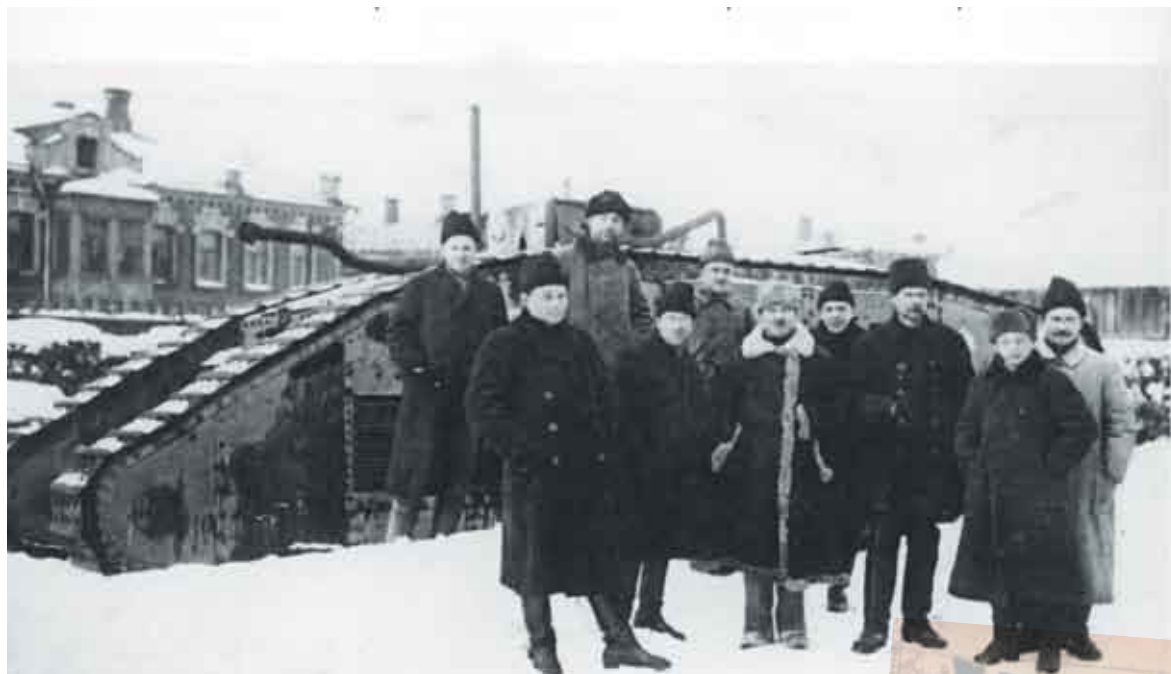
Рабочие завода № 37 им. Серго Орджоникидзе (впоследствии – ОАО «НПК НИИДАР») на фоне танка «Риккардо»

министру сообщал: «Немцы вспахивают поля сражений градом металла и ровняют с землей всякие окопы и сооружения, заваливая часто их защитников землей. Они тратят металл, мы – человеческую жизнь! Они идут вперед, окрыленные успехом, и потому дерзают, мы – ценою тяжких потерь и пролитой крови». С каждым месяцем войны русская армия все сильнее испытывала нехватку современного вооружения и мобильной подвижной