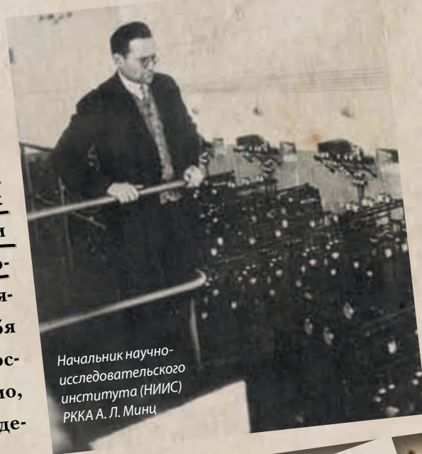
Начальник научно-исследовательского института (НИИС) РККА А. Л. Минц

2 декабря 1918 года В. И. Ленин утвердил декрет, касающийся радиолaborатории в Нижнем Новгороде. Основные установки декрета сводятся к следующему: «Радиолaborатория с мастерскими рассматривается как первый этап к организации в России Государственного радиотехнического института, целью которого является объединить в себе и вокруг себя все научно-технические силы Российской Федерации, работающие в области радио, электротехники и электротехнической промышленности».