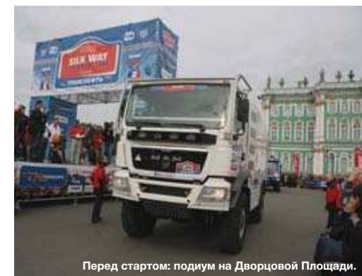
Перед стартом: подиум на Дворцовой Площади.