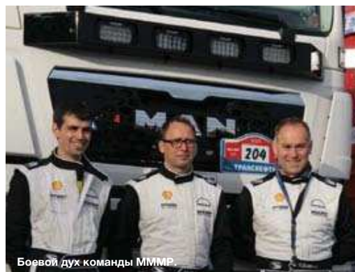
Боевой дух команды MMMP

Команда Maurer-MAN-Motorsport-Performance (MMMP) была создана специально для участия в ралли-рейде «Шелковый Путь». Болид на базе шасси MAN TGS WW принял участие в самом ожидаемом автоспортивном событии года в России. Правда, MAN TGS WW 18.480 4x4, несмотря на название, довольно сильно отличается от своих стандартных собратьев. Автомобиль изготовлен по категории T4.2.