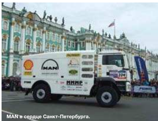
MAN в сердце Санкт-Петербурга.