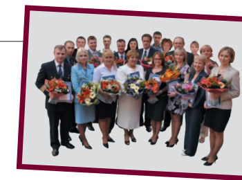
Лучшие сотрудники «Трансаэро» по итогам конкурса 2010 года (подробнее — в газете «Время «Трансаэро», №5-6, 2010).