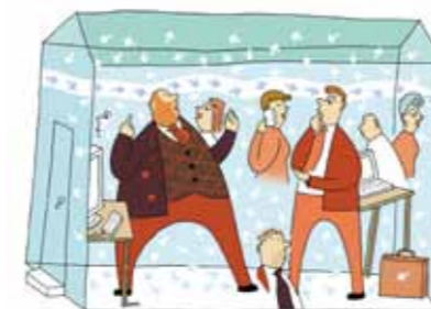
ИЛЛЮСТРАЦИИ: АНССИ КЕРНЕН

Как только мозг переходит в состояние постоянной потребности в информации, его продуктивность снижается.